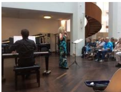
Zondagochtendconcert in 'De Bazel'

Voor het eerst organiseerde de Leo Smit Stichting in samenwerking met het Stadsarchief een serie