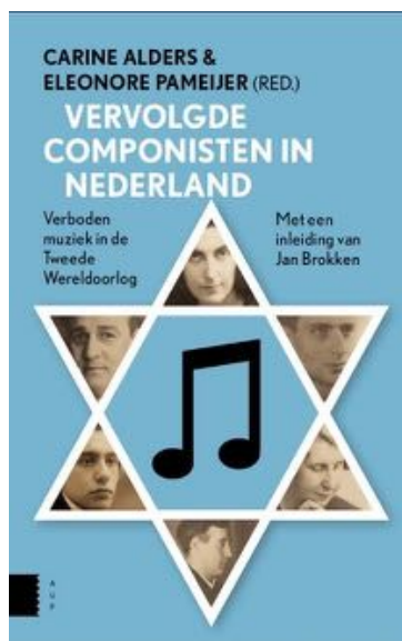
Publicatie over vervolgde componisten

Ook in 2016 werden weer componistenportretten toegevoegd aan de website, zowel in het Engels als in het Nederlands (Bertus van Lier, Paul Seelig). De bezoekersaantallen stegen met 42% tot 15.835 unieke bezoekers (25.111 bezoeken). Opvallend was een piek in het bezoek rond 27 januari (herdenking van de bevrijding van Auschwitz, 189 bezoeken op de dag zelf, ruim twee keer zoveel als het gemiddelde dagbezoek). Ook rond de opening van de tentoonstelling werd de website vaker dan anders bezocht. De meest bezochte pagina is 'Composers' (Engelstalig) met ruim 16.000 bezoeken, gevolgd door de Nederlandse equivalent 'Componisten' en de pagina 'Uilenburger Concerten'.