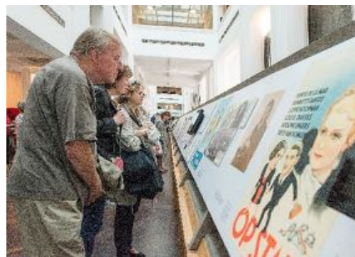
Stadsarchief Amsterdam: bezoekers tijdens opening tentoonstelling