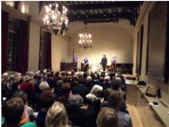
Utrecht String Quartet in Bethaniënklooster

Het negentiende seizoen Uilenburger Concerten bestond uit zes concerten in het Bethaniënklooster. Naast zelden uitgevoerd werk van vervolgde componisten uit Oostenrijk, Tsjechië en Hongarije (Richard Stöhr, Viktor Ullmann, Hans Gál en Bela Bartók) stond ook weer een première van een