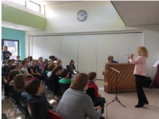
Educatie Nicolaas Maesschool